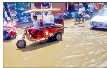
सोनीपत। भीत गतान चौक पर जलभराव से निकलते वाहन, दोपहर 12 बजे सूरी पेट्रोल पंप वाली सड़क पर साइडों में जमा बारिश का पानी।

सोनीपत। लगातार तीन दिनों तक बारिश के बाद वीरवार को तेज धूप और उमस ने लोगों को फिर से परेशान कर दिया। हालांकि बुधवार देर रात आई तेज बारिश ने मौसम में ठंडक घोल दी थी, लेकिन वीरवार की सुबह तेज धूप के साथ शुरू हुई। जिसकी वजह से बारिश के कारण नम हुई धरती ने उमस पैदा कर दी। इसी वजह से पूरा दिन धूप और उमस से गर्मी के कारण लोगों को परेशानी हुई। हालांकि तापमान में कुछ खास बदलाव नहीं हुआ। वीरवार को अधिकतम तापमान 33 डिग्री पर रहा, वहीं न्यूनतम तापमान 27 डिग्री पर बना रहा। वहीं मौसम विशेषज्ञों की मानें तो शुक्रवार को फिर से बारिश के आसार बने हुए हैं। इसके अलावा मानसून के भी इस बार जल्दी पहुंचने की संभावना है। जिसके तहत उम्मीद जताई जा रही है कि 24 जून तक मानसून एनसीआर में पहुंच जाएगा। बता दें कि रविवार से लगातार हर रोज बारिश या बूंदबांदी हो रही है। जिसके कारण मौसम में ठंडक बन रही है। बुधवार देर रात को भी बारिश ने मौसम को ठंड किया, लेकिन वीरवार की सुबह का आगाज तेज धूप के साथ हुआ। जिसके कारण पिछले सप्ताह की गर्मी की थोड़ी झलक दिखाई दी। हालांकि तापमान में कोई खास बदलाव नहीं आया, लेकिन उमस और तेज धूप की वजह से लोगों को गर्मी परेशान करती ही दिखाई दी। आने वाले दिनों की बात करें तो मौसम विभाग के अनुसार आने वाले दिनों में एक और पश्चिमी विक्षोभ के सक्रिय होने की संभावना है, जिसके चलते क्षेत्र में पुनः बूंदबांदी हो सकती है।