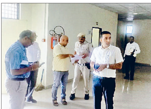
सोनीपत। वेयरहाउस का निरीक्षण करते हुए उपायुक्त एवं अन्य अधिकारी।

जिला निर्वाचन अधिकारी एवं उपायुक्त डॉ. मनोज कुमार ने वीरवार को ईवीएम-वीवीपैट वेयरहाउस का निरीक्षण किया और व्यवस्थाओं का जांचा लिया। निरीक्षण के दौरान उपायुक्त ने ईवीएम-वीवीपैट की सुरक्षा के लिए सिक्योरिटी गार्ड की लॉग बुक, ड्यूटी रजिस्टर, अग्निशमक यंत्रों, सीसीटीवी कैमरा, बिजली व सफाई व्यवस्था इत्यादि अन्य बिन्दुओं की सूक्ष्मा से जांच की। जिला निर्वाचन अधिकारी ने ईवीएम वेयरहाउस का निरीक्षण के दौरान संबंधित अधिकारियों व कर्मचारियों को