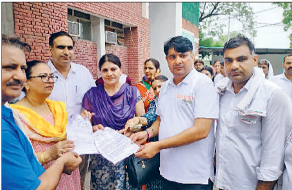
सोनीपत। लघु सचिवालय के बाहर विरोध प्रदर्शन करते हुए मंच के पदाधिकारी एवं सदस्यगण।

गांव सलिमसर माजरा की दलित बस्ती में स्थित शराब ठेका न हटाए जाने को लेकर दलित पिछड़ा शोषित आवाज मंच संगठन के दर्जनों सदस्यों ने आज प्रशासन के खिलाफ जोरदार विरोध प्रदर्शन किया। प्रदर्शनकारियों ने लघु सचिवालय के बाहर धरना देते हुए सिटी मजिस्ट्रेट को ज्ञापन सौंपा और ठेका हटाने की मांग दोहराई। धरने का नेतृत्व कर रहे संगठन के राज्य अध्यक्ष एडवोकेट