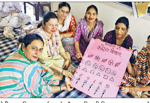
सोनीपत। प्रशिक्षण कार्यक्रम के दौरान प्रतिभागी शिक्षक।