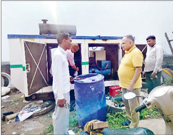
सोनीपत। निरीक्षण के दौरान कर्मचारियों के साथ मौजूद मेयर राजीव जैन।

बैठक के दौरान अधिकारियों ने मेयर को बताया कि खादू धाम स्थित डिस्पोजल पर एक अतिरिक्त मोटर लगा दी गई है। साथ ही सभी डिस्पोजल स्टेशनों पर जर्नरटर सेट की व्यवस्था कर दी गई है ताकि बिजली बाधित होने की स्थिति में भी कार्य प्रभावित न हो। इसके अतिरिक्त पांच ट्रेक्टर पंप तैयार किए गए हैं और सात पंप किराये पर लेने के लिए टेंडर भी लगाए जा चुके हैं ताकि आपात स्थिति में त्वरित जलनिकासी सुनिश्चित की