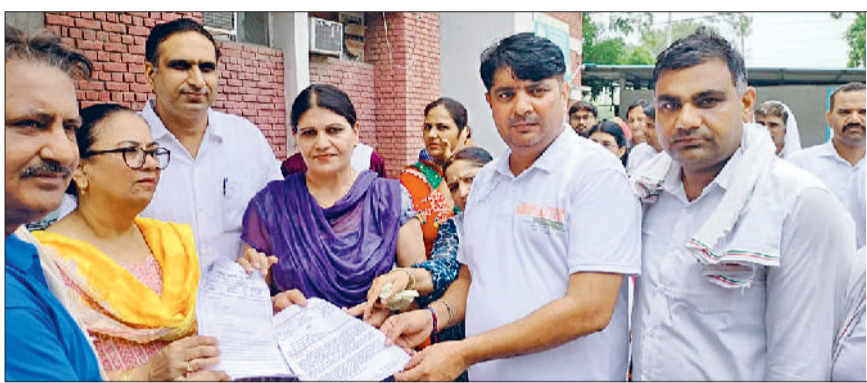
सोनीपत। अस्पताल परिसर में इकट्ठा हुए कर्मचारी व अपनी मांगों को ज्ञापन सौंपते हुए।