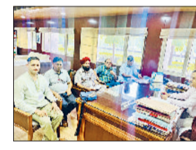
सोनीपत। कमेटी की बैठक लेते हुए कुलगुरु।