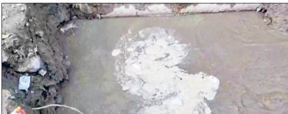
गन्ौर। पेयजल लाइन टूटने से व्यर्थ बह रहा पानी।